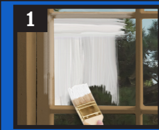
1 Brush on Glass & Trim