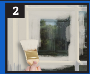
2 Paint Trim